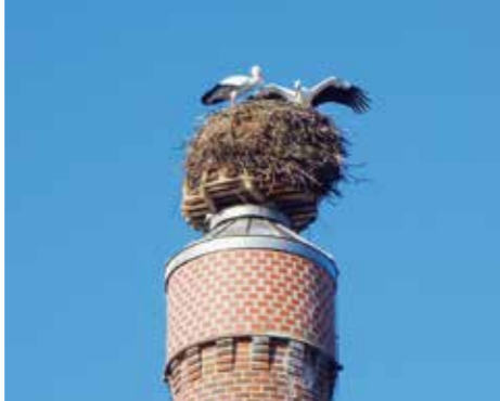
Geisenfelder Storchennest auf dem Brauereikamin