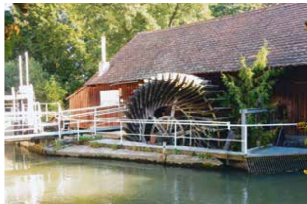
Mühlrad an der Hatzlmühle