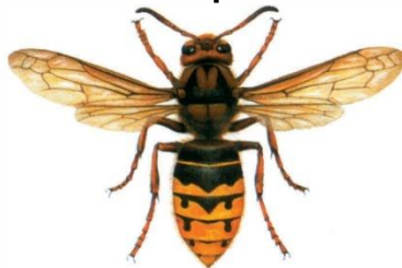
Hornisse ( Vespa crabro )