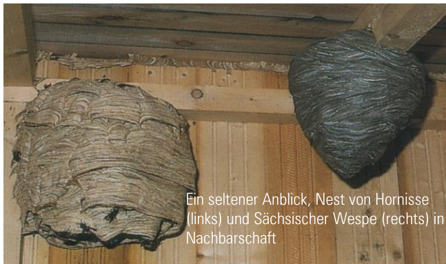
Ein seltener Anblick, Nest von Hornisse (links) und Sächsischer Wespe (rechts) in Nachbarschaft

Wespennester sind einjährig. Jedes Jahr wird ein neues Nest gebaut. Das alte Nest wird aufgegeben und kann im Winter nach mehreren Frosttagen entfernt werden.