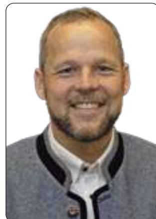
Manfred Betzin 1. Bürgermeister