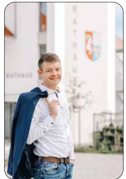
Tobias Endres 1. Bürgermeister